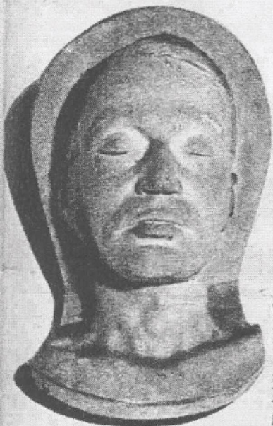
Ady Endre halotti maszkja

tötte össze ebbe a múzeumba Ady használati tárgyait, emlékeit. Az érmindszenti Ady-család élő tagjai felküldték annak a