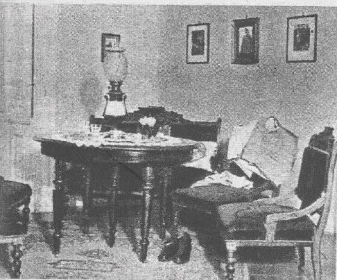
Interieur Ady lakószobájából

szobának bútorait, ahol a nagy költő fiatal éveit töltötte. Az egyszerű faágygal a költő ágyneműje is megérkezett. Szerényen húzódik meg a fal mellett a ruhásszekrénye. A szoba egyik sarkában a költő szalonbútorainak zöld plüshuzatú darabjait láthatjuk, a szép faragásos asztalon pedig az érmindszenti petróleumlámpa áll, amelynek fénye mellett a nagy költő fiatalkori verseit álmodta.